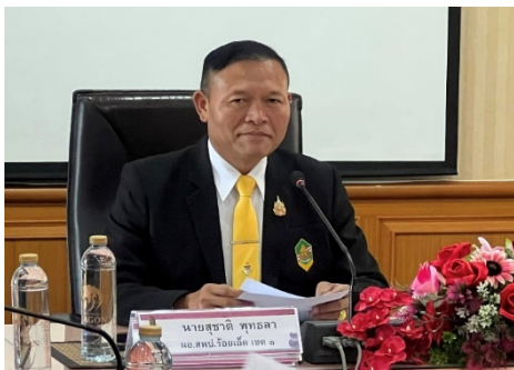
มอบนโยบาย