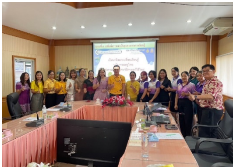
ประชุมคณะกรรมการ