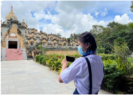
ศึกษานอกสถานที่