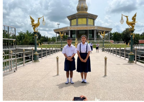
ศึกษานอกสถานที่