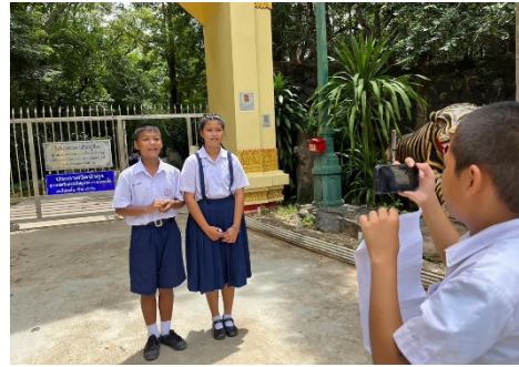
ศึกษานอกสถานที่