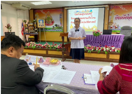
นำเสนอผลงาน