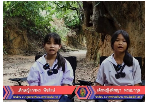
นำเสนอผลงาน