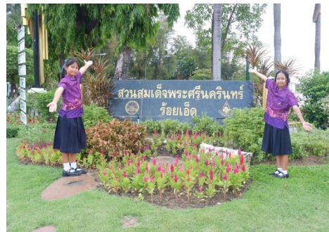
ศึกษานอกสถานที่