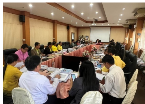
พิจารณางบประมาณ