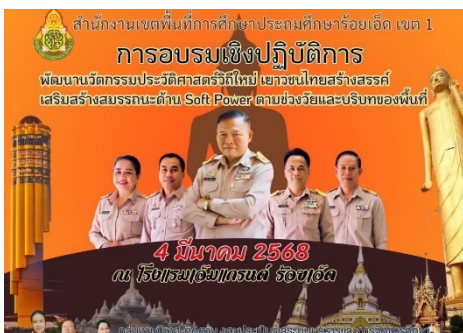
จัดอบรมเชิงปฏิบัติการ