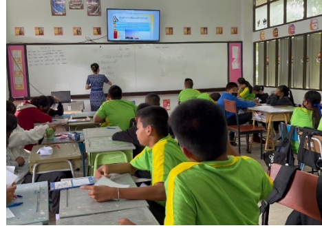
จัดกิจกรรมการเรียนรู้