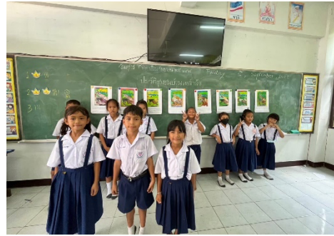
จัดกิจกรรมการเรียนรู้