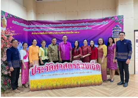
ประวัติศาสตร์ร้อยเอ็ด