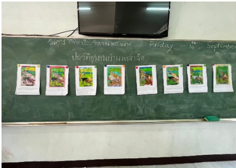
จัดกิจกรรมการเรียนรู้