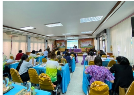
ประชุมคณะกรรมการ