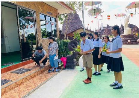
ศึกษานอกสถานที่