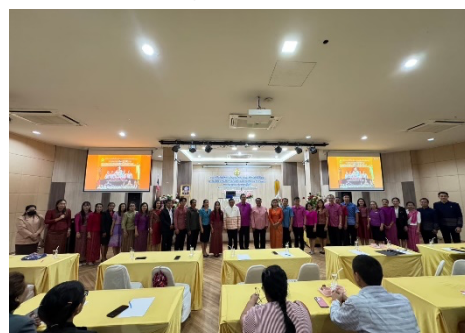
อบรมเชิงปฏิบัติการ