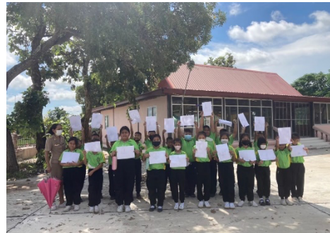
จัดกิจกรรมการเรียนรู้