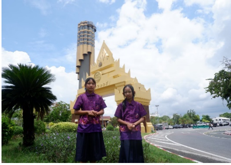
ศึกษานอกสถานที่