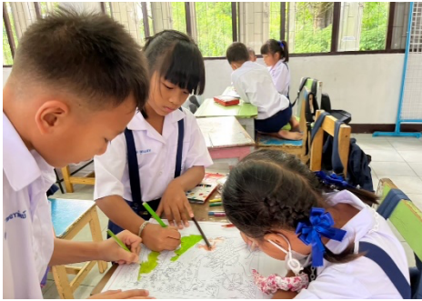
จัดกิจกรรมการเรียนรู้