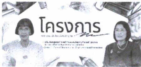
โครงการ / กิจกรรมเด่นโรงเรียนวิถีพุทธ KP-MCU