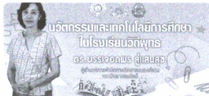
นวัตกรรมโรงเรียนวิถีพุทธ KP-MCU