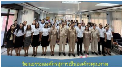
วัฒนธรรมองค์กรสู่การเป็นองค์กรคุณภาพ